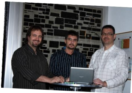
Redaktionsbesprechung im Februar 2011.