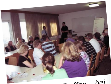
Unser erstes Treffen, bei dem auch die Benennung „Wiiler Gemeinde Hock“ ins Leben gerufen wurde.

Wie Ihr auf der abgebildeten ersten Seite des ersten Wiiler Blättle lesen könnt, war es ein Herzensanliegen unseres Stammapostels Leber und auch unseres Bezirksapostels und Apostels, dass wir uns in den Gemeinden und der Gemeinschaft wohlfühlen. Dies veranlasste uns dazu, dass wir uns überlegten, wie wir unsere Gemeinde noch mehr zu einer Wohlfühlgemeinde ausbauen können.